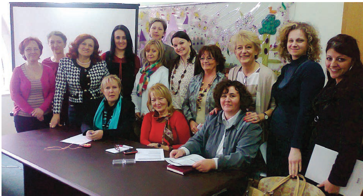
Први договор - заједничко деловање носиоца делатности

Договорено је да се организује Конгрес стручних радника предшколских установа Србије.